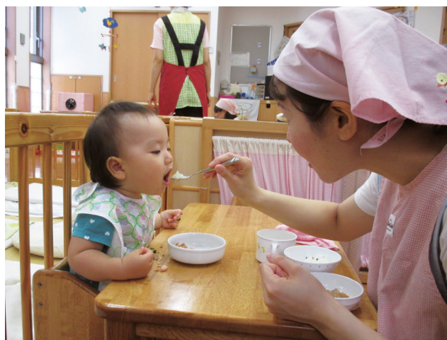
0歳児クラスの食事の様子