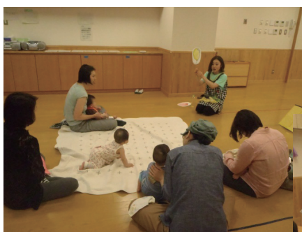
ふれあい遊びの様子