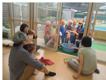
色水あそびの様子

毎月1回、地域のお子さんを対象に行っている「あそびましょ」では、身体測定、園庭開放、そして保育園ならではの楽しい企画を行う「お集まり」の時間があります。保健担当や栄養士など専門の職員もいますので、子育てについての疑問・悩みにもお答えしています。