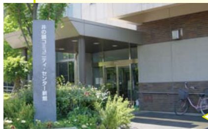
●井の頭コミュニティ・センター

井の頭地域を担当する三鷹市井の頭地域包括支援センターが牟礼にあり、少し距離があることや、高齢化が進むこの地域の住民の皆様から、地区に相談窓口を作って欲しいとの強い要望があったことから、平成22年4月、三鷹市が井の頭コミュニティ・センターの新館に開設し、当事業団が委託を受け運営しています。