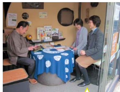
●西野園での「まちなか協働サロン」