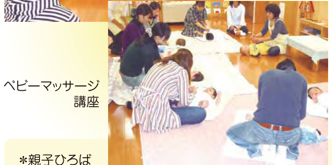
ベビーマッサージ 講座