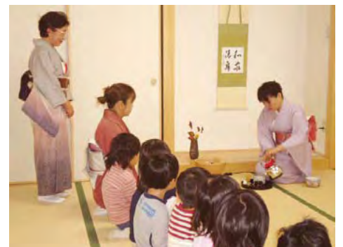
三鷹市立ちどりこども園でのお茶会

5歳児は2年間の間に計6回参加し、卒園までに自分でお茶を点てられるようになり、3月の最終回には「おしるし」というお免状をいただけます。取り組んできたことが形となり子ども達の達成感や喜びにもつながっています。園の職員だけでなく地域のボランティアの方の力を借りての豊かな経験としてのお茶会、和室があるちどりこども園ならではの取り組みとなっています。