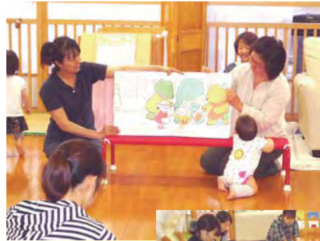
ボランティアによる 読み聞かせ

サークルやボランティアの方による読み聞かせは、子どもたちが地域の方とふれあうとてもいい機会だと思います。普段のお楽しみ会の中でも絵本を読んでいます。読み聞かせがある日は子どもたちの注目の仕方が違うように感じます。また、絵本サークルのみなさんは絵本を読むだけでなく、劇や歌を入れたり小道具を使ったりするなどの工夫をこらし、その様子に子どもたちも興味津々でした。