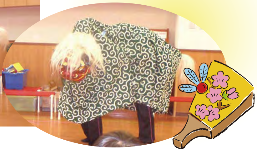
三鷹市立西野保育園での獅子舞